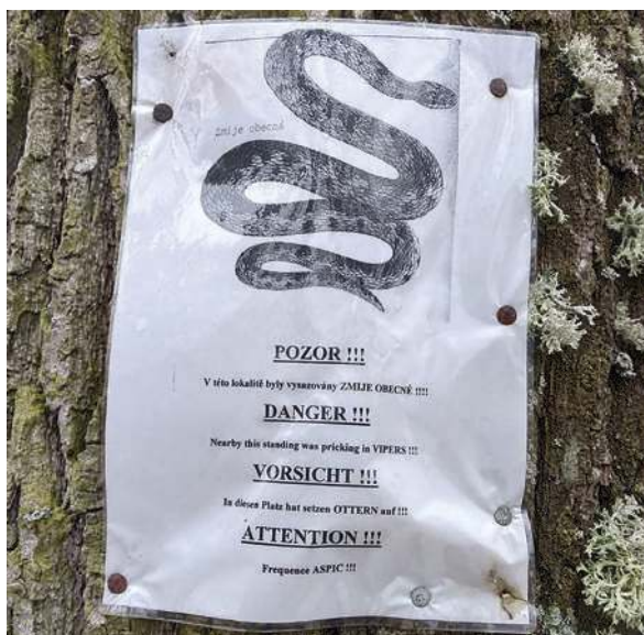
Foto 1: Na Třeboňsku se objevil plakátek „upozorňující“ na domnělé vysazování zmijí. Jedná se o falešnou a poplašnou zprávu, a proto bývají takové výzvy vždy bez uvedení autora či jiného ověřitelného zdroje.

S nástupem křesťanství došlo v oblasti přírodních věd ke stagnaci, která se výrazně prohloubila právě ve středověku. Vznikaly oblíbené bestiáře, jakési čítanky, knihy o zvířatech bez uvedení autora. Přinášely něco z Aristotela, něco z Plinia, odvolávaly se na bibli, obsahovaly verše i prózu a byly plné pověr a omylů. Tyto knihy se těšily popularitě dlouhá staletí a s nimi přežívaly i nejdivočejší báchorky o plazech. Báchorky se ovšem objevovaly nejen v knihách anonymů. Například dominikánský mnich Vincent z Beauvais ve své knize Zrcadlo přírody (Speculum naturale) přímo tvrdil, že had, stejně jako medvěd, slouží ďáblu. Dobrému vztahu křesťanů k plazům nepřispěl ani kult sv. Jiří, jenž je nejčastěji zobrazován, jak zabíjí draka (obr. 6). Také přísloví „Na svatého Jiří vylézají hadi a štíři“ (štíři = ještěři) nesvědčí o oblíbenosti této skupiny živočichů. Sv. Patrik je Iry oslavován nejen za to, že přinesl křesťanství, ale také i za to, že v celém Irsku vyhubil hady. Obrovského a jedovatého hada Paiste však přehlédli. Krátce po smrti svatého Patrika začal tento had ničit oblast kolem Lough Foyle. Místní lidé se nakonec obrátili na svatého muže jménem Murrough. Ten hada přemohl a uvěznil ho v podzemí u pramenů řeky Foyle, kde zůstává dodnes. Neobvyklé záplavy a přívaly této řeky